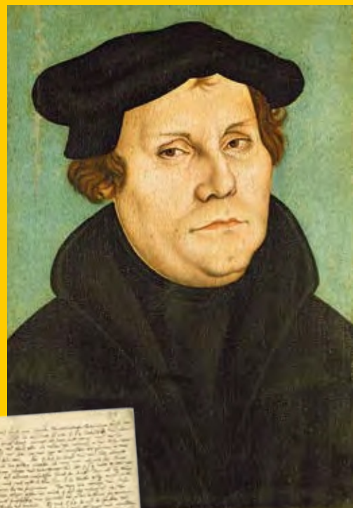
Porträt Martin Luthers von Lucas Cranach d.Ä., 1528

Etwas mulmig war dem Landgrafen doch. Philipp suchte Rat beim geistlichen Führer der Reformation und legte ihm die neue Kirchenordnung vor. Martin Luther reagierte sehr schnell. Die neue Ordnung sei „ein Hauffen Gesetze“, beschied er dem Landgrafen in einem ausführlichen Schreiben. Luther befürchtete, dass ein allzu abrupter Wandel von Kirche und Gesellschaft der reformatorischen Sache mehr schaden als nützen könnte. Philipp folgte Luthers Rat, und die modern anmutende Homberger Kirchenordnung trat niemals in Kraft.